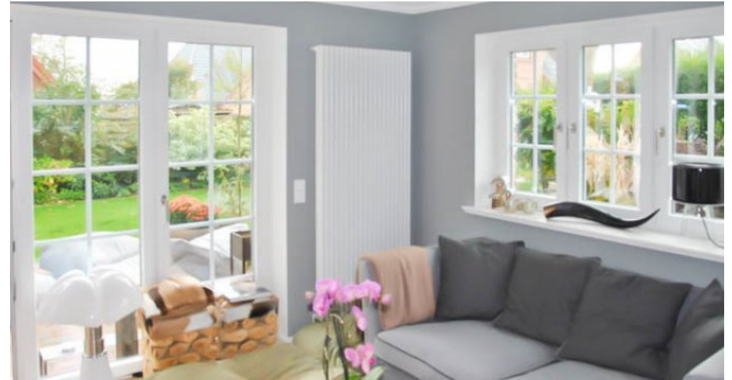
WZ mit Austritt Süden