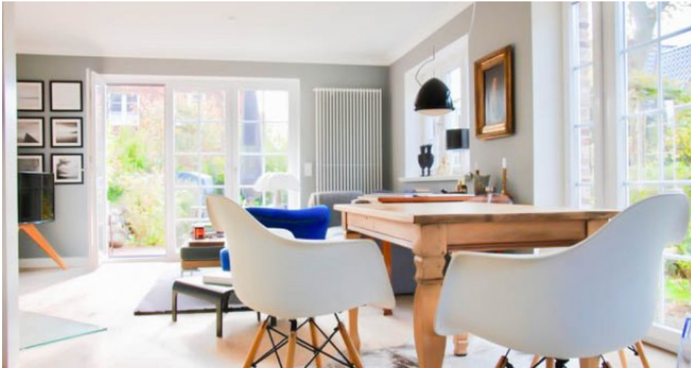
Wohn-Esszimmer mit Austritt Süden