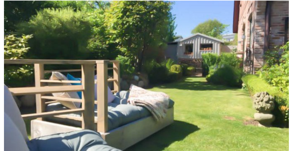
Ansicht Westen mit Holzhaus