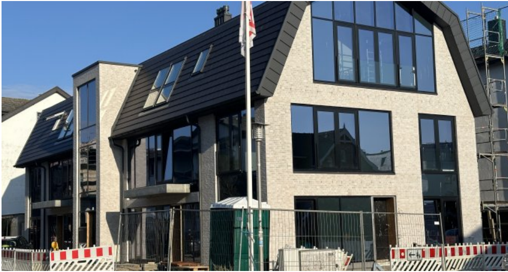
Aktueller Stand 24.07.2024