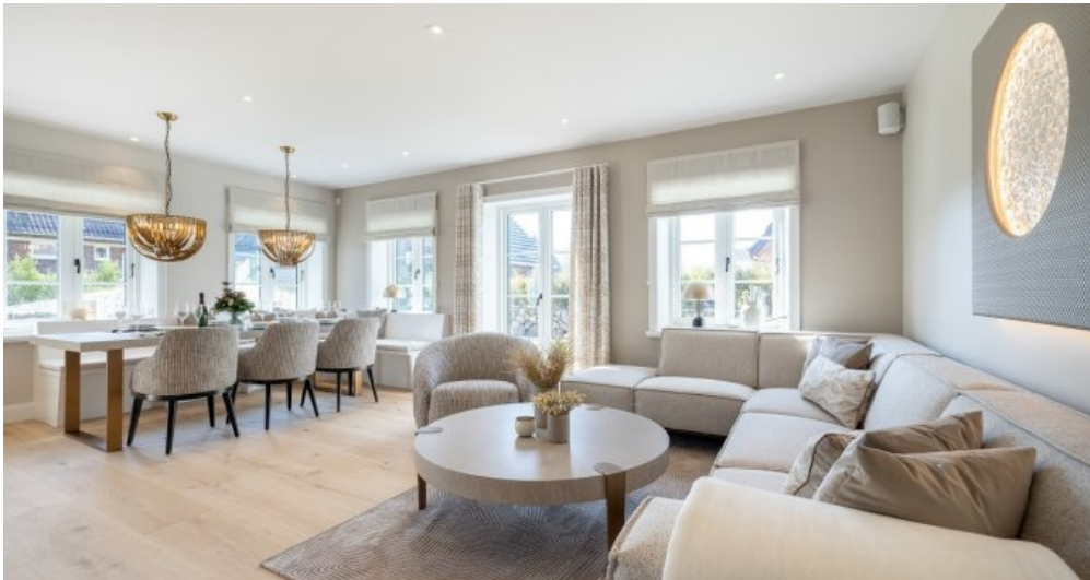
1 Beispielobjekt Wohn-Esszimmer