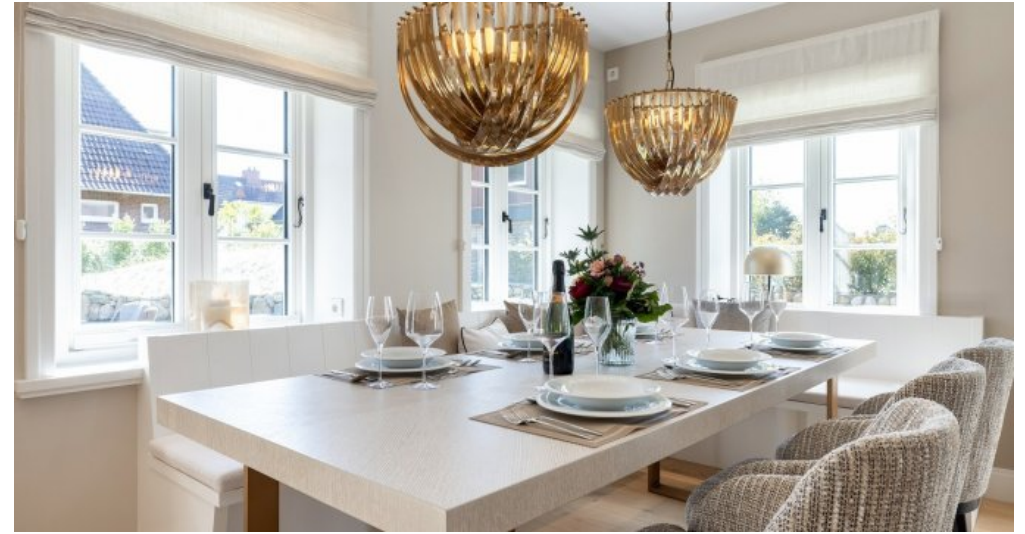
Beispielobjekt des Bauträgers 3