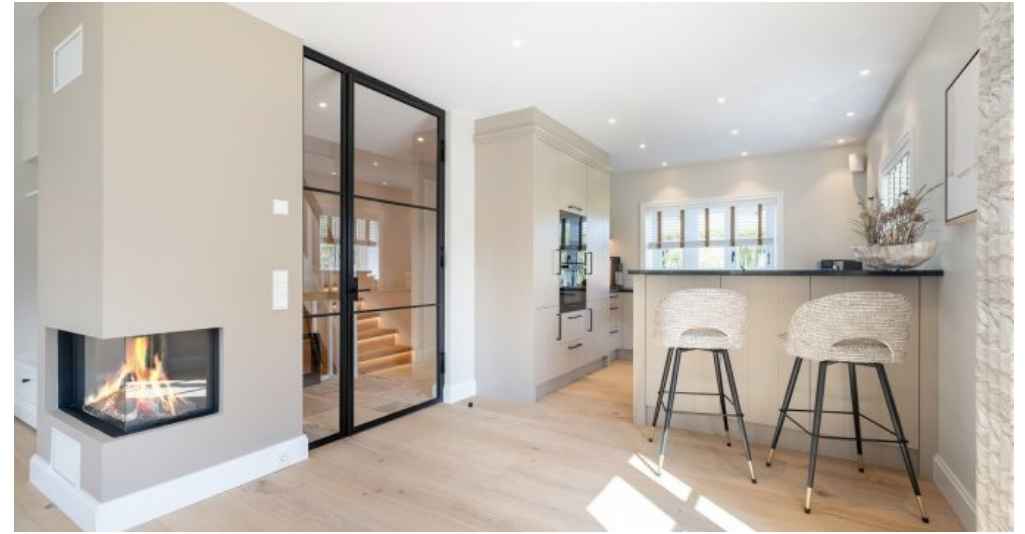
2 Beispielobjekt Küche, Kamin