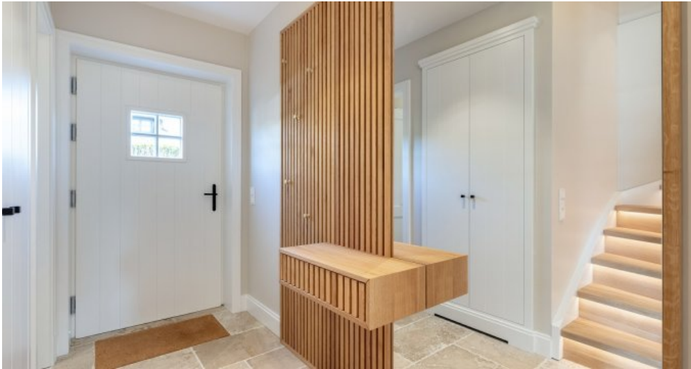
3 Beispielobjekt Eingangsbereich