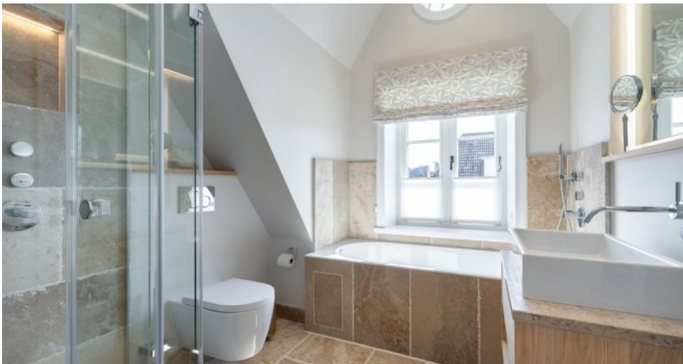
7 Beispielobjekt hochertige Bäder